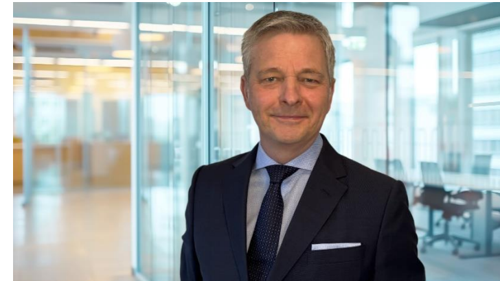
Gernot Labs (Bild: 2025)